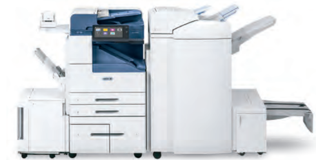
Equipo multifunción Xerox® AltaLink® B8045/B8055/B8065/ B8075/B8090