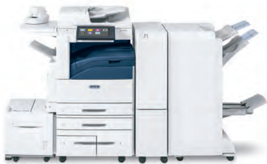
Equipo multifunción en color Xerox® AltaLink® C8030/C8035/ C8045/C8055/C8070