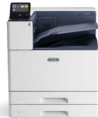
Impresora color Xerox® VersaLink® C9000