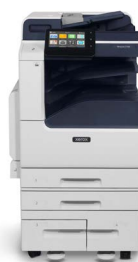
Equipo multifunción color Xerox® VersaLink® C7120/C7125/ C7130