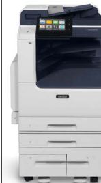
Equipo multifunción Xerox® VersaLink® B7125/B7130/ B7135