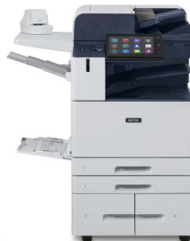
Equipo multifunción color Xerox® AltaLink® C8130/C8135/ C8145/C8155/ C8170