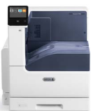
Impresora color Xerox® VersaLink® C7000