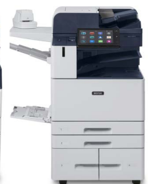
Equipo multifunción Xerox® AltaLink® B8145/B8155/ B8170

* El producto no está disponible en todas las regiones, consúltelo con su representante de ventas.