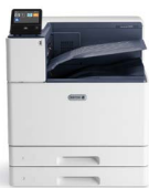
Impresora color Xerox® VersaLink® C8000