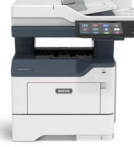
Equipo multifunción Xerox® VersaLink® B415