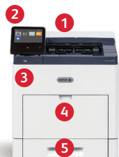
Impresora Xerox® VersaLink® B600 Impresión.