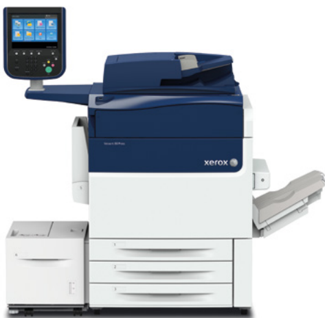
Prensa Xerox Versant 80