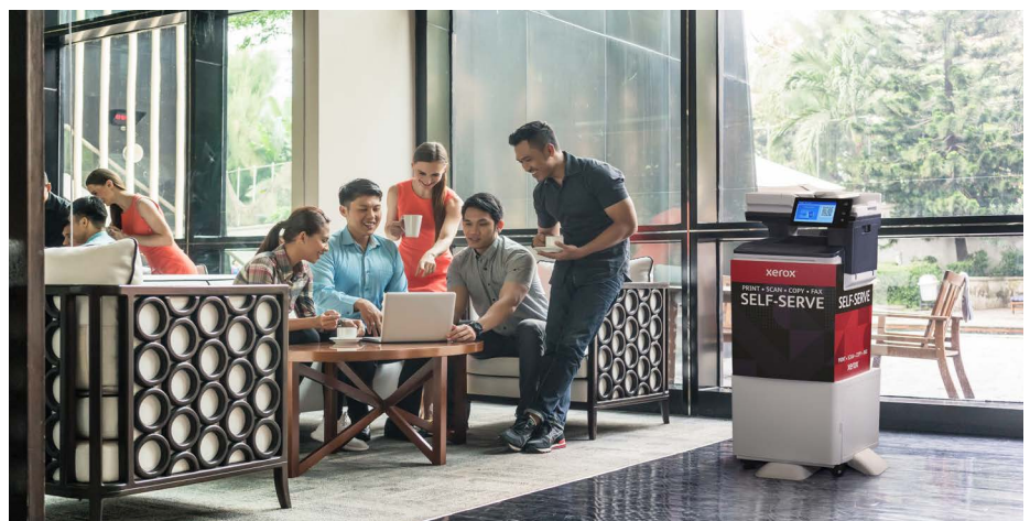
Equipo multifunción color Xerox® VersaLink® C415

Workplace Kiosk es un elemento clave en la industria de la impresión que se puede colocar en casi cualquier entorno. Los clientes simplemente tienen que escanear un código QR en la impresora para transformar su dispositivo móvil en un equipo multifunción remoto. Una experiencia intuitiva, sin contacto y sin complicaciones.