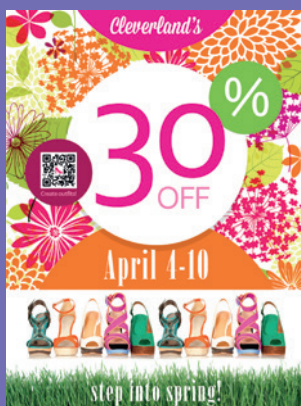
Punto de venta

Producir grandes cantidades de trabajos de gran formato solía implicar diversos inconvenientes: la necesidad de recurrir a varias impresoras y dedicar varios días a satisfacer las demandas de un solo cliente. No es de extrañar pues que en ocasiones estos trabajos se considerasen un problema. Pero con la impresora Xerox Wide Format IJP 2000, son una verdadera oportunidad de negocio.