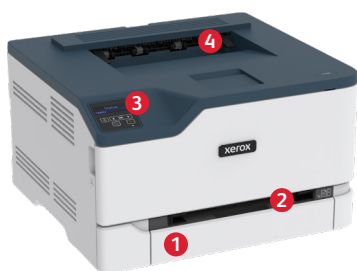
mpresora color Xerox® C230