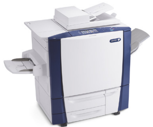
La imagen incluye opciones adicionales

Analice sus documentos y vea cuánto podría ahorrarse en