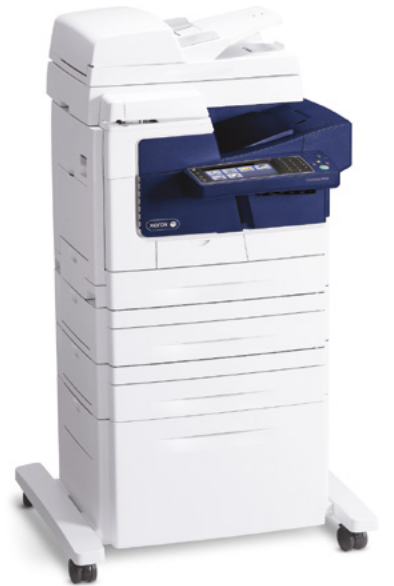
La imagen incluye opciones adicionales