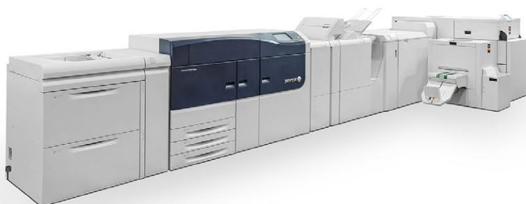
Watkiss PowerSquare™ 160 en una prensa Xerox® Versant® 3100

Para obtener más información sobre el realizador de folletos Watkiss PowerSquare™ 160 y las opciones de acabado disponibles, póngase en contacto con el vendedor de Xerox o visite www.xerox.com .