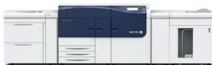
Prensa Xerox® Versant® 2100