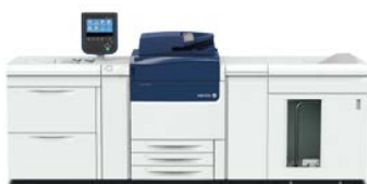
Prensa Xerox® Versant® 80

Sustituya su vieja prensa por una prensa Xerox® Versant® 80, una prensa Xerox® Versant® 2100 o una prensa de color Xerox® 800i/1000i para disfrutar de una gestión del color uniforme y fiable. Obtendrá una calidad de color extraordinaria de forma rápida y sencilla, mejorando la productividad y rentabilidad con cada uno de sus trabajos.