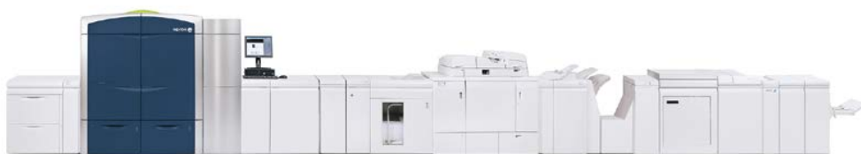
Prensas de color Xerox® 800i/1000i