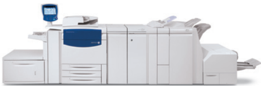
Prensa digital de color Xerox 700