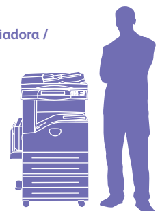
WorkCentre 5230 con módulo de doble bandeja