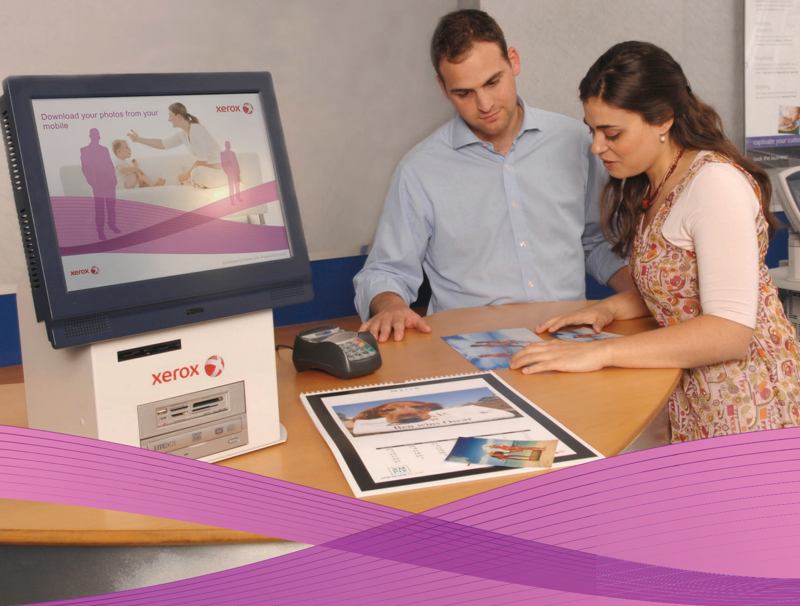
Foto Kiosco Xerox en asociación con Imaxel Productos fotográficos fascinantes y rentables con la prensa digital Xerox