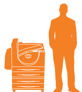
Phaser 5550 DT con alimentador de 1000 hojas

5550B, N, DN: 640 x 525 x 498 mm 5550DT: 640 x 525 x 778 mm