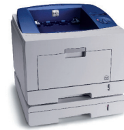
Phaser 3435 con bandeja 2 opcional