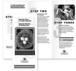
Plegado en diptico, plegado en C y plegado en Z