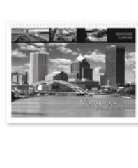
Perforación de juego de troquelado