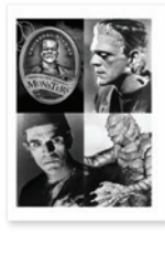
Folleto guillotinado SquareFold