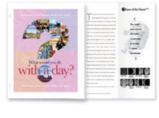
Inserciones de color, grapado y plegado en Z de ingeniería